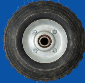
819-UMLLA LLANTA PARA UNIDAD MOVIL PIEZA