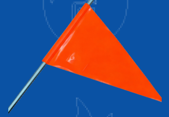
BAN-CAM BANDERIN PARA CAMION RECTO NARANJA