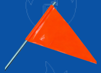
BAN-CAM BANDERIN PARA CAMION RECTO NARANJA