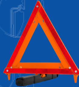
TRIA-44SEG TRIANGULO DE SEGURIDAD 44 CM CON ESTUCHE