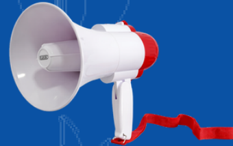
550-M055 MEGAFONO C/BATERIA RECARGABLE 200 MTS