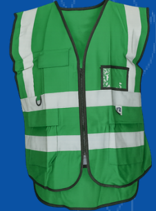
550-CH09SP CHALECO RESCATISTA CON CINTA REFREJANTES HB "VERDE" SP