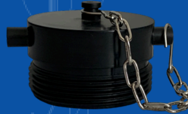
966-TM04 TAPON TOMA SIAMESA MACHO 2½ NST DE PLASTICO NEGRO