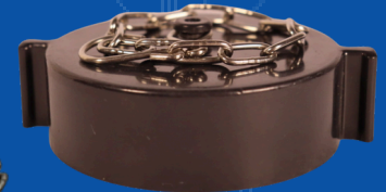
966-T011 TAPON PLASTICO 2 1/2 NST HEMBRA