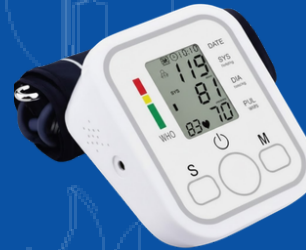
910-001D MONITOR DIGITAL AUTOMÁTICO DE TOMA DE PRESIÓN BRAZO