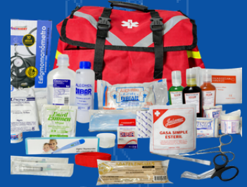
342-018B MOCHILA BOTIQUIN EQUIPADA