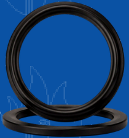
654-E005 2.5" NST