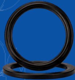
654-E002 1.5" NST