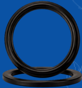
654-E003 2" IPT