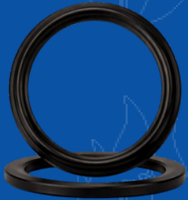
654-E004 2.5" IPT