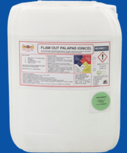
550-R064 RETARDANTE P/PALAPAS 20 LTS