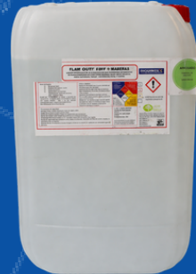
550-R066 RETARDANTE PARA MADERAS VIRGENES 20 LITROS