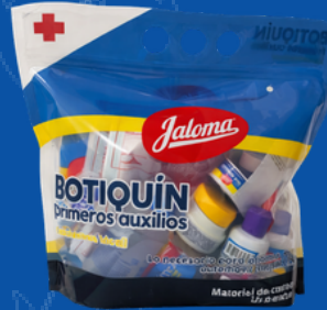
342-MED MEDICAMENTO PARA BOTIQUIN (BOLSA)