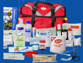
342-018B MOCHILA BOTIQUIN EQUIPADA