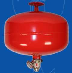
243-SPHFC006 GRANADA DE 6 KG HFC-236 LLENA