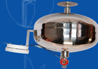
243-SP006D DETEXTINTOR ACERO INOXIDABLE SS304 6 LTS