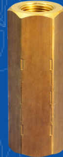
194-BOQ BOQUILLA PARA MANGUERA