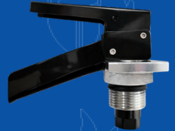
194-095SP VALVULA EXT SP TUBO Y MANOM SAL MAN 1/4