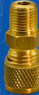
194-301CO2V VALVULA DE PIVOTE P/ DETEX 3 A 12 KG