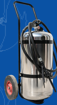
819-SP050INOX KIT UNIDAD MOVIL 50 L ACERO INOXIDABLE VACIA 304SS