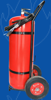
819-SP050 KIT UNIDAD MOVIL 50 KG SPARTAN VACIA