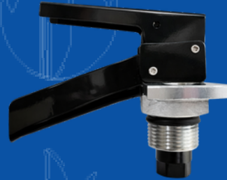
194-095SP VALVULA EXT SP TUBO Y MANOM SAL MAN 1/4