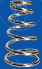
194-066SP RESORTE PARA EXTINTOR PORTATIL SPARTAN