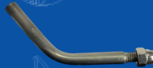
194-085G TUBO DESCARGA CO2 5 LBS. BADGER GENERIC