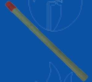
194-086E TUBO SIFON EXTINTOR DE 1.0 K