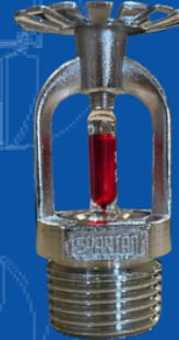
194-070SP ROCIADOR 1/2 PENDENT 68 GRADOS CROMADO SPARTAN