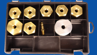
194-022 JUEGO DE CONECTORES PRUEBA HIDROSTATICA (LATON 9 PIEZAS)