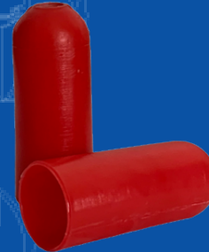
194-020 CORNETA KIDDE 5/8 PARA MANGUERA EXTINTOR PORTATIL