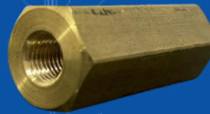
194-015 CONEXION PARA CARGAR ESFERA VARIAS MARCAS (chino)