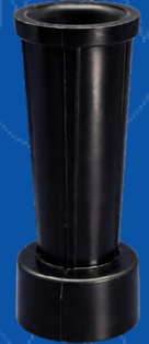
194-015 CONEXION PARA CARGAR ESFERA VARIAS MARCAS (chino)