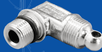
194-013GEN CODO DIFUSOR 10,15,20 LIBRAS CO2 GEN