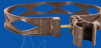
194-SP008 CINCHO PARA EXTINTOR CO2 10 Y 15 LBS SPARTAN