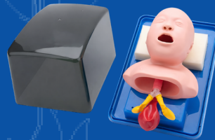
001-MANP MANIQUI DE INTUBACIÓN PEDIATRICO